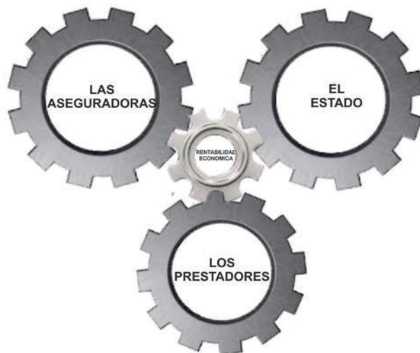
Figura. El sistema de salud al servicio de los grupos de interés y su rentabilidad económica

La situación expuesta es provocada por un sistema de salud que gira en torno a la enfermedad como insumo fundamental para producir rentabilidad económica.