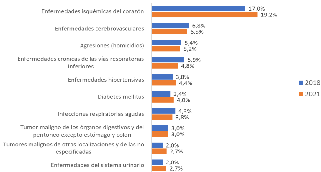
Diez primeras causas de muertes en Colombia 2018 Vs 2021.