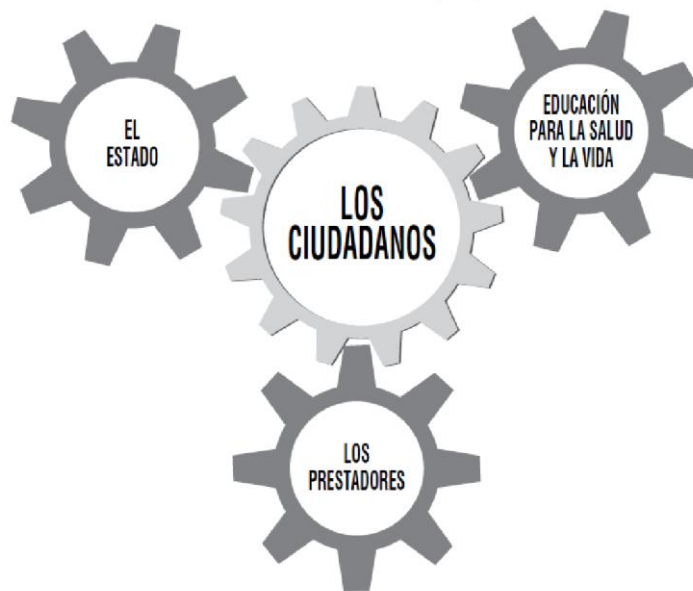
Figura. El sistema de salud al servicio de los ciudadanos